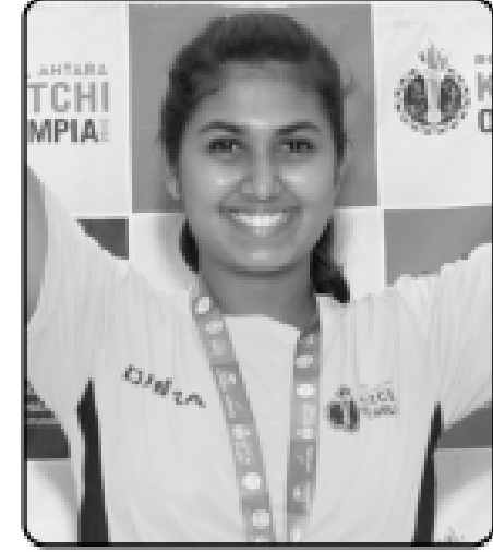
મણાલી તુપાર કારાણી-ઠેઢાબાદ ગોલ્ડ મેડલ બેડમિન્ટન (૧૬ થી ૧૮ વર્ષ)