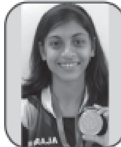
વામા શાહ સીલ્વર મેડલ-૧૦૦ મી. બ્રોન્ઝ મેડલ-વેટલિમિટન કબલસ