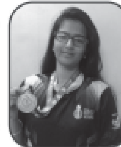
હેલ્વી સાવલા સીલ્વર મેડલ જ્યેલીયન ઘો