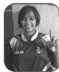
વેશા બુધિયા બ્રોન્ઝ મેડલ વેટલિમિટન કબલસ